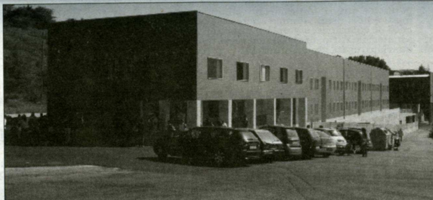
Nuove costruzioni a Bucaletto

tra gli altri obiettivi, il confort abitativo, la vivibilità, la salubrità e la sicurezza, anche attraverso la risoluzione di problemi di mobilità. Prevista altresì la realizzazione e l'adeguamento di opere di urbanizzazione primaria e secondaria, il miglioramento della prestazione energetica degli edifici che sfrutta una riduzione di almeno il 30% del fabbisogno di energia, calcolato secondo quanto indicato dalla normativa attualmente in vigore. Tutto questo garantendo fattibilità urbanistica e rapida cantierabilità.